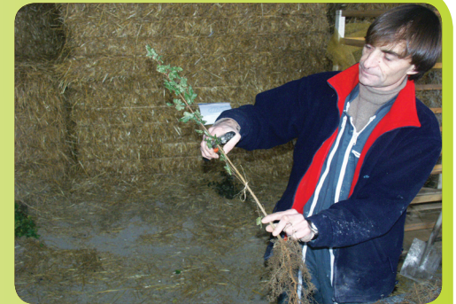
Rabattre les arbustes