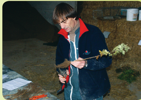
Habiller les plants (racines)