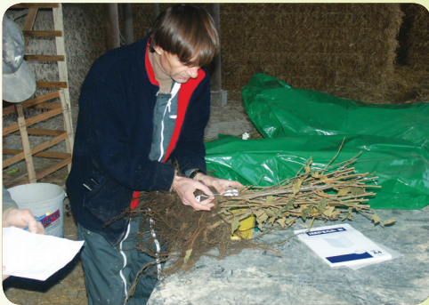
Trier les plants