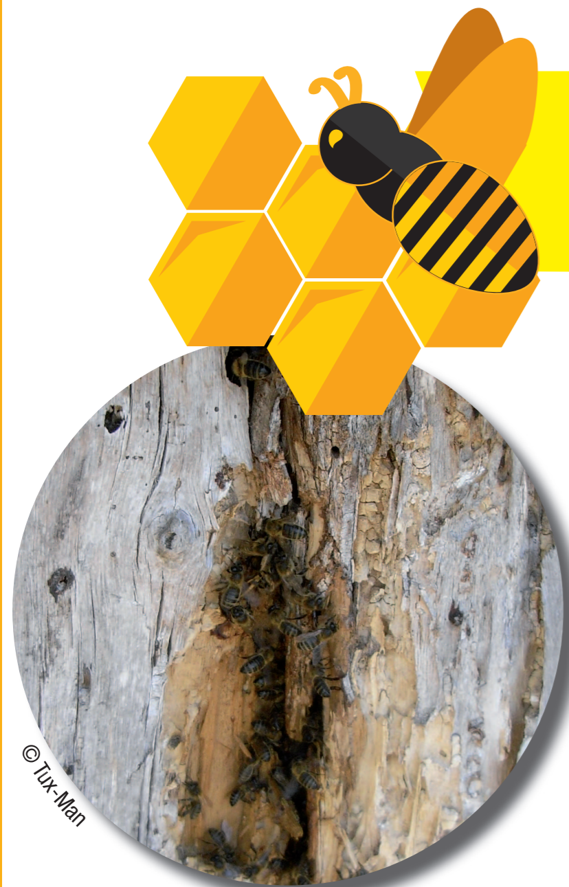
Nid d'abeille dans un arbre

Les abeilles peuvent vivre sans l'Homme dans des trous en hauteur dans les troncs , les falaises ou les cheminées mais la ruche leur apporte un confort et un support pour leur colonie. L'Homme a exploité les produits de ruches sauvages dès la Préhistoire . Un rassemblement de ruches en un même endroit est appelé un rucher . Les ruches modernes sont de plusieurs formes. La plus utilisée en France est la ruche Dadant :