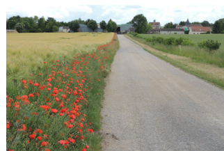
Bord de champs