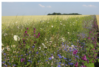
Bande de jachère mellifère