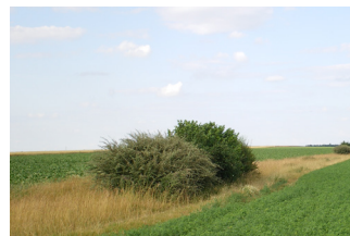
Bande tampon bouchon

Retrouvez l'ensemble des aménagements agro-écologiques sur notre site : www.symbiose-biodiversite.com