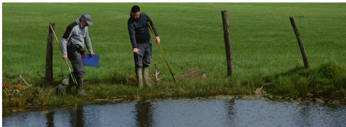
Ces mares favorisent une biodiversité fonctionnelle utile à ces écosystèmes fragiles tout en gardant un intérêt agronomique

La Fondation du Patrimoine vient d'octroyer une dotation exceptionnelle de 100 000 euros pour la rénovation des mares dans le Chaourçois. Le projet mêle biodiversité et engagement. Une première dans la région.